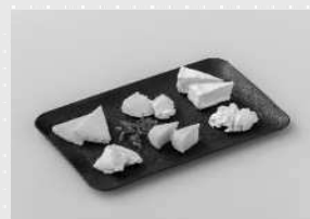
鹿児島県知事賞 「Japan Cheese Awards受賞 チーズセット」