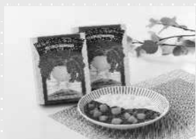
鹿児島市長賞 「桜島だいこん 溶岩カレー」