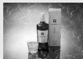
鹿児島県貿易協会 会長賞 「ARAWAZA Stannum」