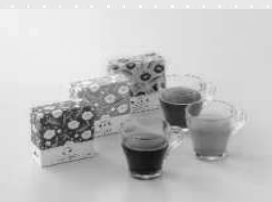
鹿児島県特産品 協会理事長賞 「セレクトBOXティーバッグ (知覧茶・紅茶・ほうじ茶)」