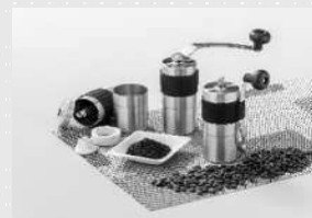
鹿児島県貿易協会 会長賞 「ポーレックス ヨーヒーミル・ミニ プロフェッショナル」

昨年度、アンケート回答があった出品者のうち、 100% (50名/50名) の方が出品して良かったと回答!