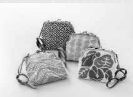
鹿児島県特産品 協会理事長賞 「Poché」