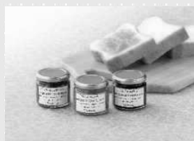
鹿児島県特産品 協会理事長賞 「サワーポメロ& ゆずジャム」