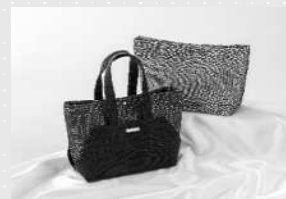
鹿児島県知事賞 「大島紬締め織りコンビ バッグ「TWY' CE」」