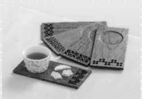
鹿児島市長賞 「薩摩焼割付文様柄 折敷(銘々盆)」